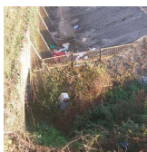
Déchets sauvages en bordure des clapets de Garonne

Une opération de nettoyage de la nature sera menée le dimanche 15 octobre à partir de 10h. Rendez à la Mairie, place des Tilleuls.